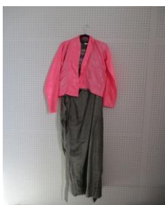
中国M14-3-A 男性・チベット