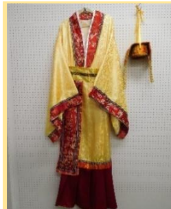
中国M03-4-B 宮廷男性・試着不可