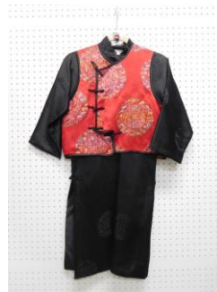
中国B06-2-A 男児 (低学年)