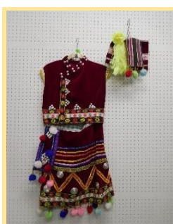
中国F21-3-B 雲南省女性・試着不可