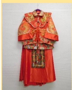
中国F25-3-A 花嫁・試着不可