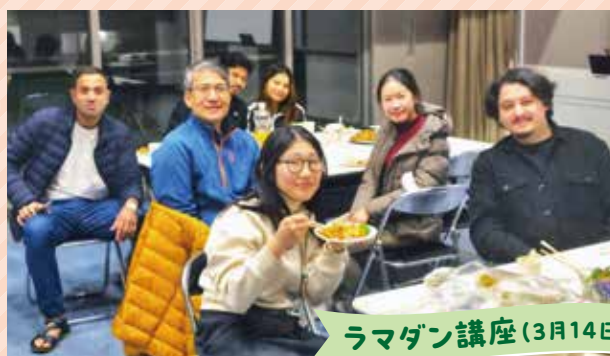
ラマダン講座(3月14日)