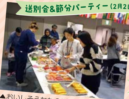
送別会&節分パーティー(2月2日)