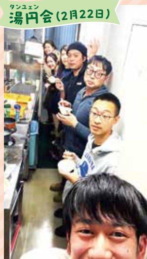
タンクエン 湯円会(2月22日)