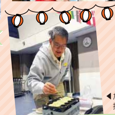
お好み焼き&たこ焼きパーティー(1月25日)