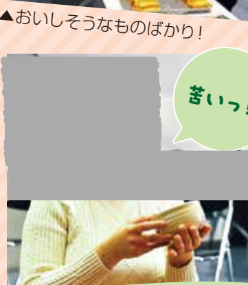
ひな祭り&抹茶体験会(3月1日)