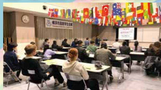
退館者説明会 注意事項が多いなあ