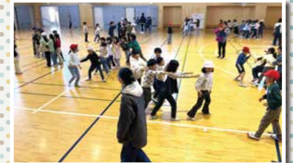
台湾のゲームでみんな大喜び