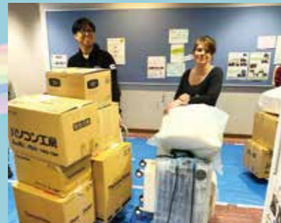
引っ越し荷物が重い