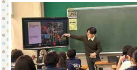
学校側の「韓国人学生希望」にも対応