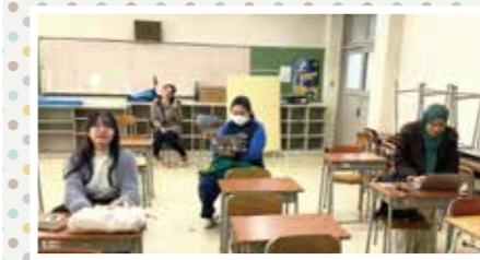
授業開始5分前の控室 ちょっと緊張ぎみ