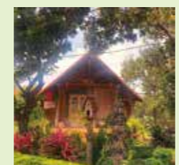
高床式の伝統的な家屋

私の故郷は、ベトナムの中部高原に位置するダクラク省です。この地域は豊かな自然と多様な文化で知られており、ベトナムの中でも特に魅力的な場所の一つです。省都はバンメトート市で、ベトナムのコーヒーの中心地として広く知られています。