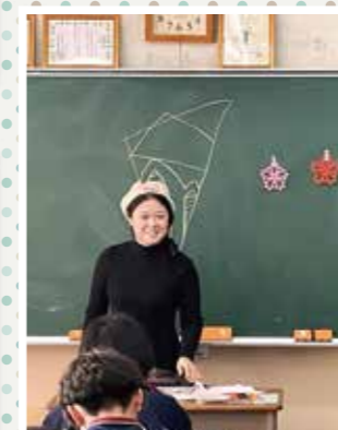
中国伝統の「切り紙」を紹介