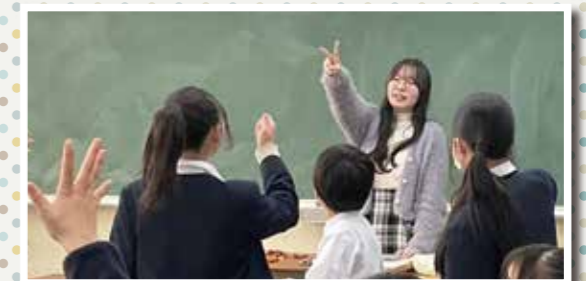
じゃんけんゲームで大盛り上がり

スクールビジットクラスの申込みは学生会館HP( https://yish-yoke.com/ )からどうぞ