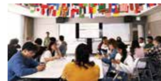
オリエンテーション 今日ちょっとリラックス