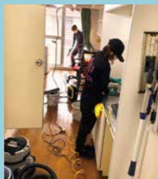
新入館者のために業者さんが大急ぎでお掃除