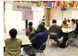
入居契約説明会 みんな神妙