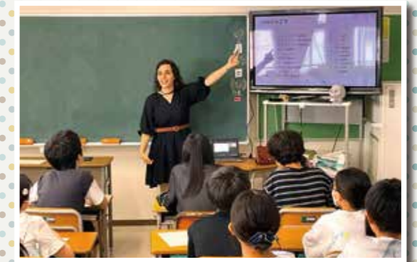
みんな熱心に聞いています