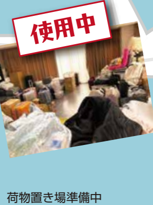
荷物置き場準備中