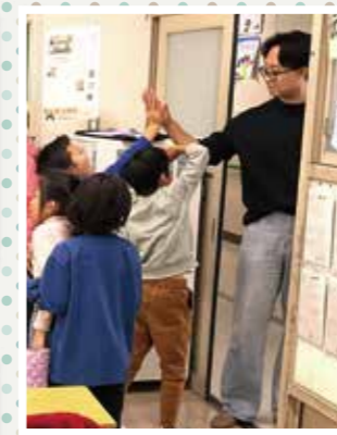
すっかり仲良くなりました