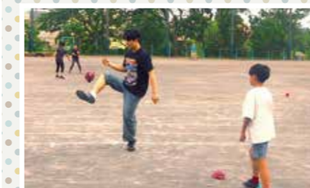
校庭で韓国の「チェギチャギ」を披露