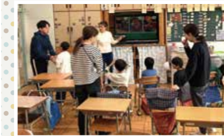
個別指導クラスの子たちもかわいい