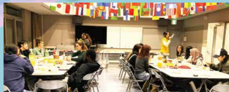
送別会 楽しいことがいっぱいあったね