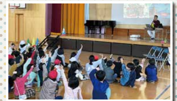
2学年合計8クラスが体育館に集合