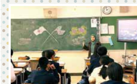
黒板いっぱい歓迎のメッセージ