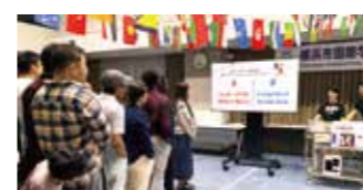
歓迎会 楽しいクイズとおいしいご馳走たっぷり