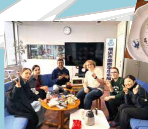
この日はドイツの朝食